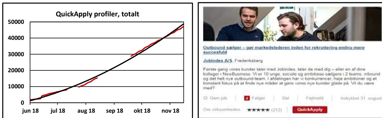
Figur 3: Antallet af QuickApply ansøgerprofiler og en jobannonce hvor man kan søge med QuickApply

Jobindex har lanceret QuickApply ansøgerprofiler, der skal gøre det nemmere at søge job via en mobiltelefon. Man uploader sit CV på Jobindex, og kan derefter søge job ved at trykke på en knap og udfylde nogle få ekstra oplysninger, og ansøgningen overføres derefter til kundens ansøgningssystem. QuickApply fungerer foreløbig med de danske ansøgningssystemer Emply og Elvium samt vores eget ansøgningssystem. På de første 5½ måneder er der oprettet 47.000 ansøgerprofiler.