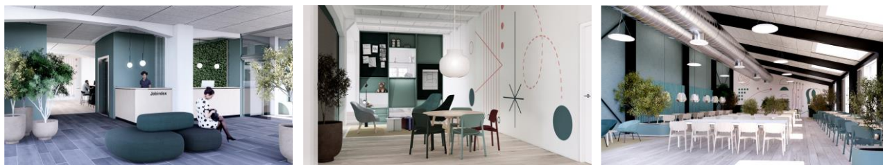
Figur 3: Visualiseringer af de nye lokaler på Carl Jacobsens Vej 29 i Valby

Efter over 20 år på Frederiksberg flytter Jobindex til nye lokaler på 7400 m 2 i Valby til efteråret, hvor vi overtager Søfartsstyrelsens gamle lokaler. Aftalen blev indgået sidste år, da vi var ved at vokse ud af de eksisterende lokaler og var usikre på, om vi kunne blive boende på Frederiksberg, og havde et ønske om at samle medarbejderne på færre adresser. De nye lokaler gør det muligt at samle medarbejderne fra Frederiksberg og Islands Brygge på samme adresse, hvilket vil gøre det nemmere at samarbejde på tværs af organisationen. Vi får nogle nyistandsatte og fremtidssikrede kontorlokaler, der ligger tæt på Ny Ellebjerg station, der bliver Københavns tredjestørste togstation, når den nye metrolinje til Sydhavn åbner i 2024. Omkostningerne til flytning, istandsættelse og nye møbler m.m. forventes at udgøre 15-20 mio. kr., hvoraf hovedparten bliver aktiveret og afskrevet over 5 år. Lejemålet er uopsigeligt i 10 år, og vi forventer at bo i de nye lokaler de næste 10-20 år.