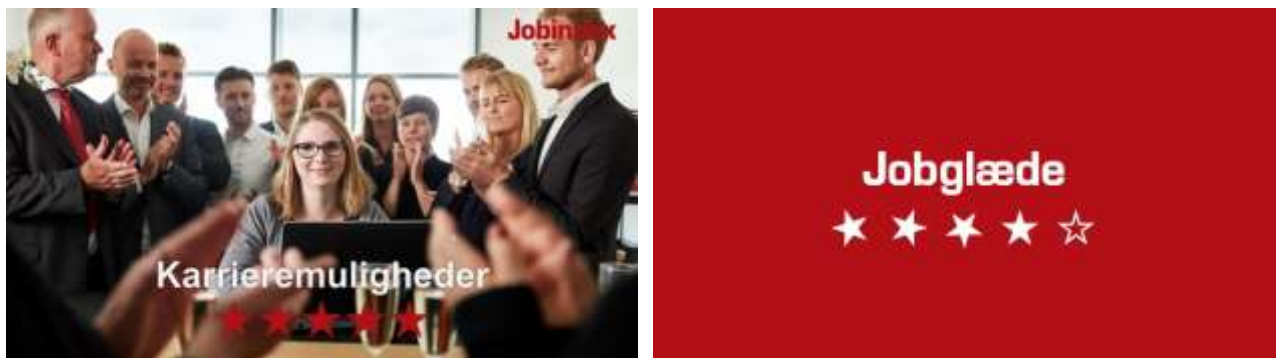
Figur 3: Screenshots fra den nye TV-kampagne om jobglæde og evalueringer af arbejdspladser

Jobindex lancerede evalueringer af arbejdspladser i januar, og de blev meget positivt modtaget. Vi har nu evalueringer af 2800 forskellige arbejdspladser, der beskæftiger 735.000 medarbejdere. I næste uge lancerer Jobindex en TV-kampagne om jobglæde og evalueringer af arbejdspladser. Jobindex hjælper virksomhederne med at tiltrække de gode kandidater, og medarbejdere med at finde et job, de er glade for. Kampagnen skal vise, at Jobindex arbejder for at fremme jobglæden i Danmark og har nogle data om arbejdspladserne, som man ikke kan finde nogen andre steder.