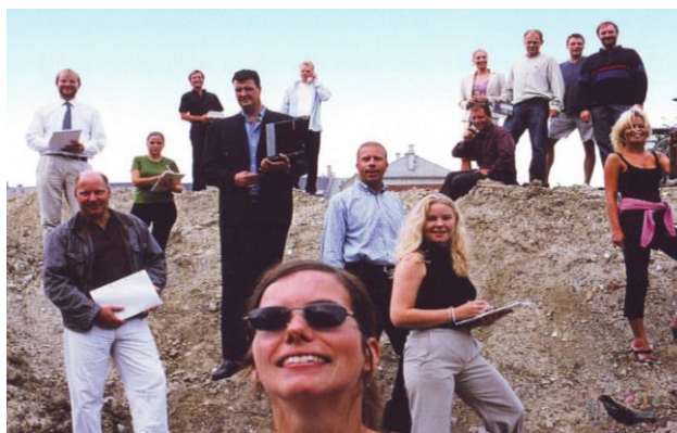
Figur 3: Avisartikel fra Dagbladet Børsen 1996 og gruppebillede fra 2001